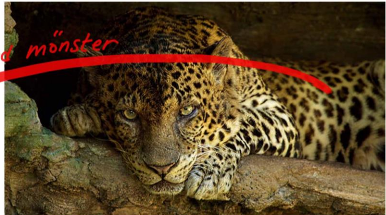
Moodboard (inspirations källor)